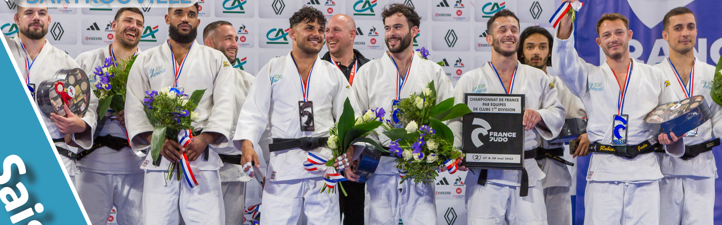
VICE-CHAMPION DE FRANCE 2023