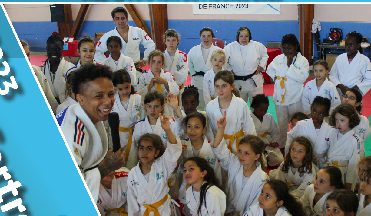
DE FRANCE 2023